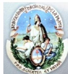
Universidad Nacional de la Plata Facultad de Ciencias Exactas